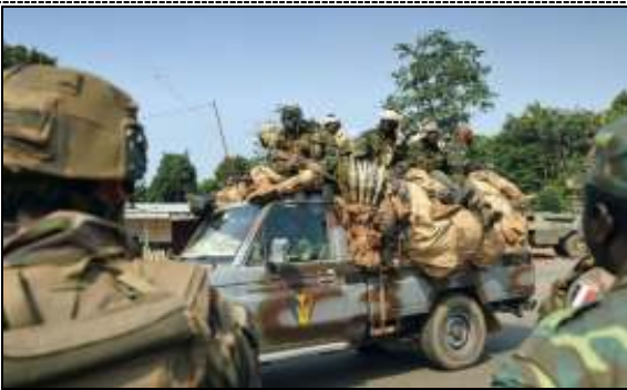
Des soldats tchadiens de la force africaine Misca passent à côté des soldats français de l'opération Sangaris, le 10 janvier 2014 à Bangui.