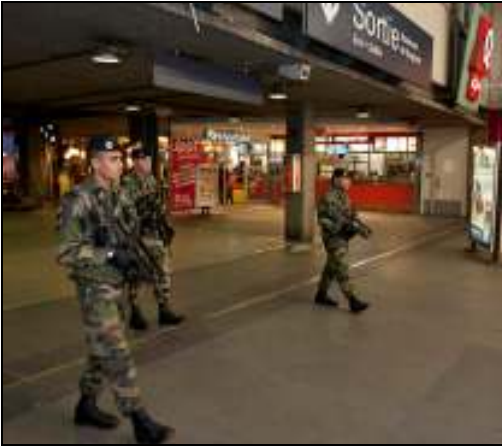
Document 1 : le plan «Vigipirate « Des militaires dans la gare de Lyon »